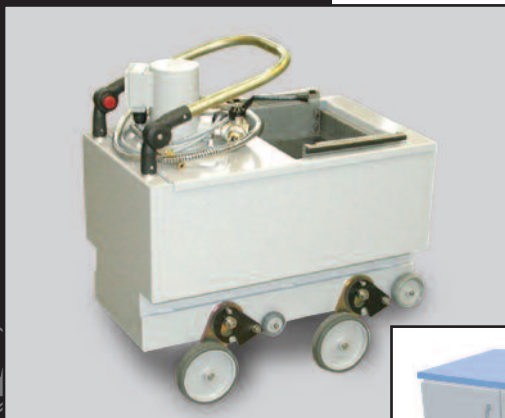
Systeme de decantation et recirculation du lubrifiant.